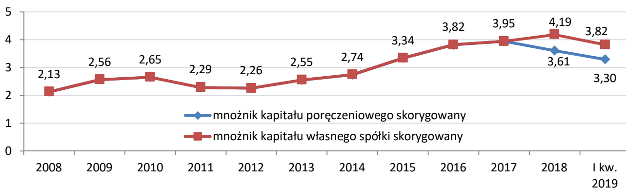
Wykres 3.3 PFPK Sp. z o.o. – wartość mnożnika skorygowanego kapitału poręczeniowego i mnożnika skorygowanego kapitału własnego